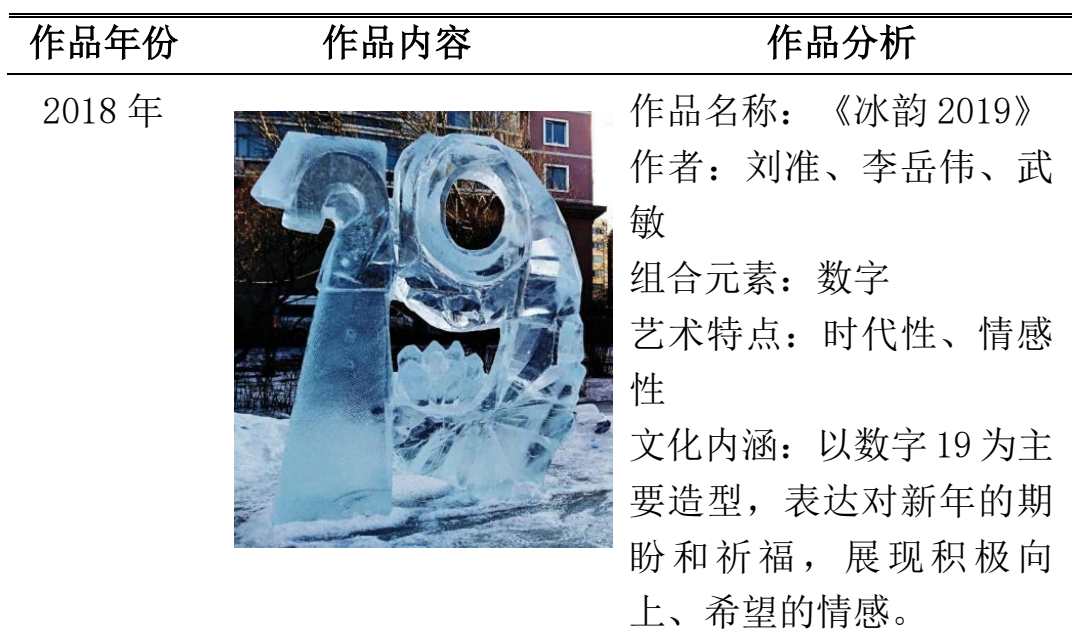
表 7 2018-2022 年东北冰雕透雕作品汇总分析