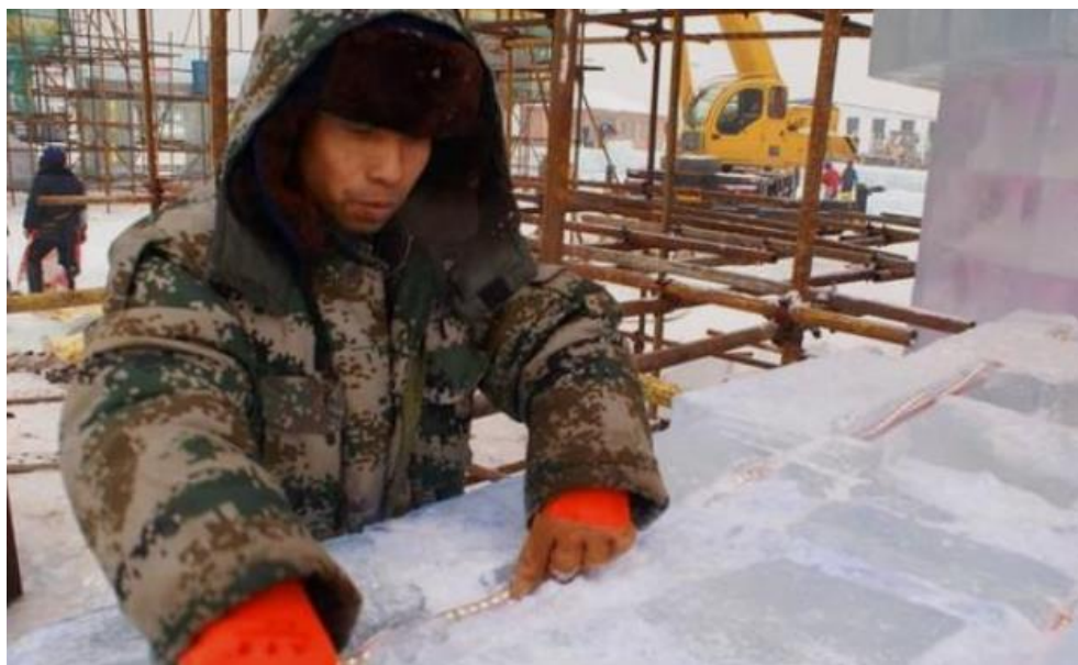
图 2 下灯过程