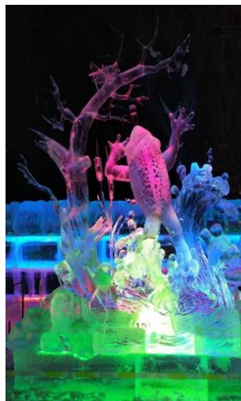
作品名称：《待时而动》

文化内涵：鹿在东北地区是一种具有象征性的动物，因为狍子等鹿种在东北大地十分常见，因此既是东北民众跟自然之间关系的象征，也是一种祥瑞代表。