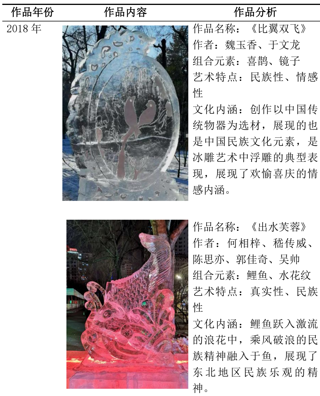
表 6 2018-2022 年东北冰雕浮雕作品汇总分析