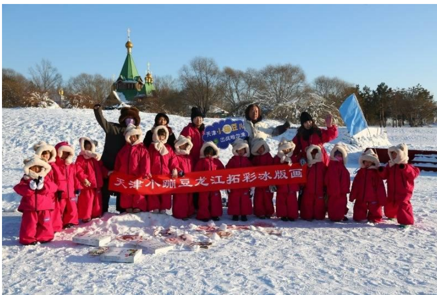
图8 天津小蹦蹦豆拓展创作