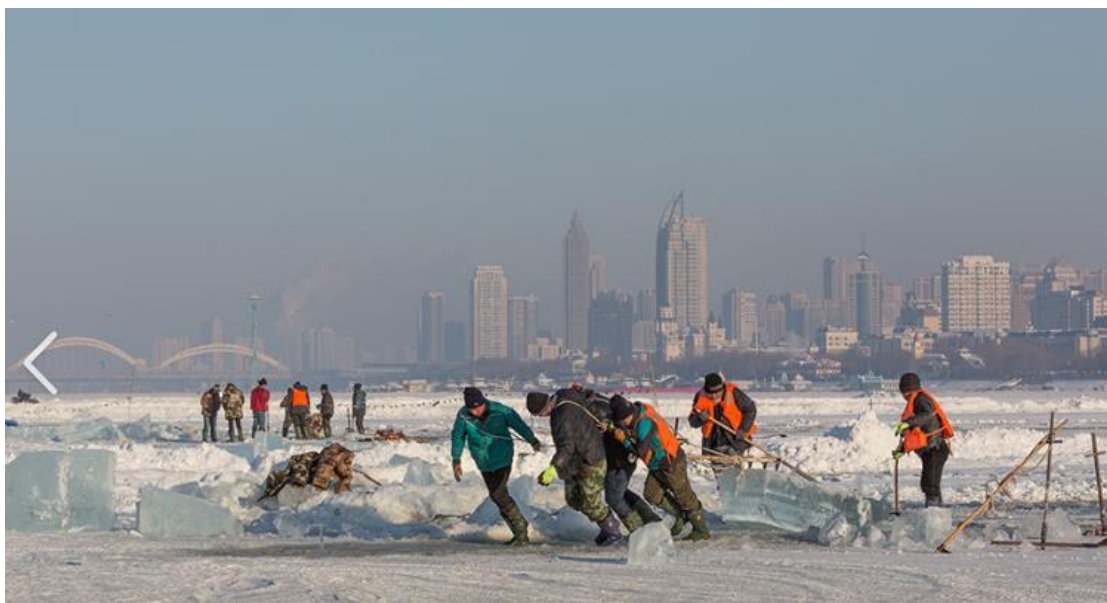
图 1 采冰过程